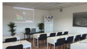
OPERATORE DI RICERCA E SALVATAGGIO

L'Associazione "SAR-PRO" ha ideato un percorso formativo per la qualifica di "Operatore di Ricerca e Salvataggio" (O.R.S.) intesa come figura professionale innovativa, connotata da competenze tecniche in materia di Ricerca e Salvataggio, ma soprattutto capace di operare in sicurezza in un teatro SAR complesso secondo protocolli base standardizzati